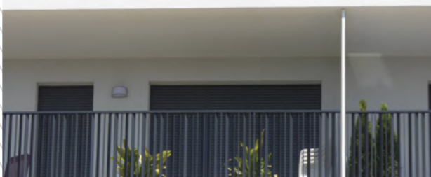
Orientação aleatória das barras.