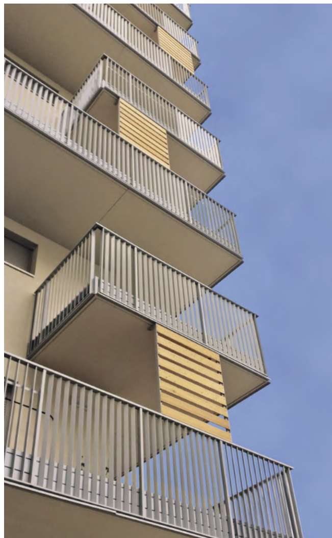
R852 (54x15 mm) com instalação à frente da aresta da laje. Projeto do gabinete Macary Page Architectes (38 – Grenoble) e Barthélémy & Grino Architectes (75 – Paris)