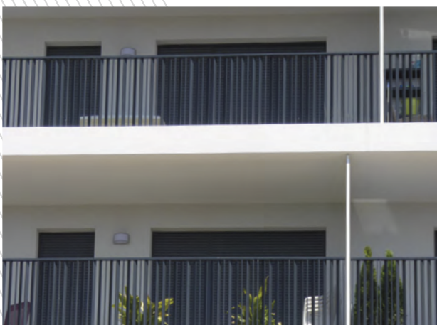
Orientação aleatória das barras.